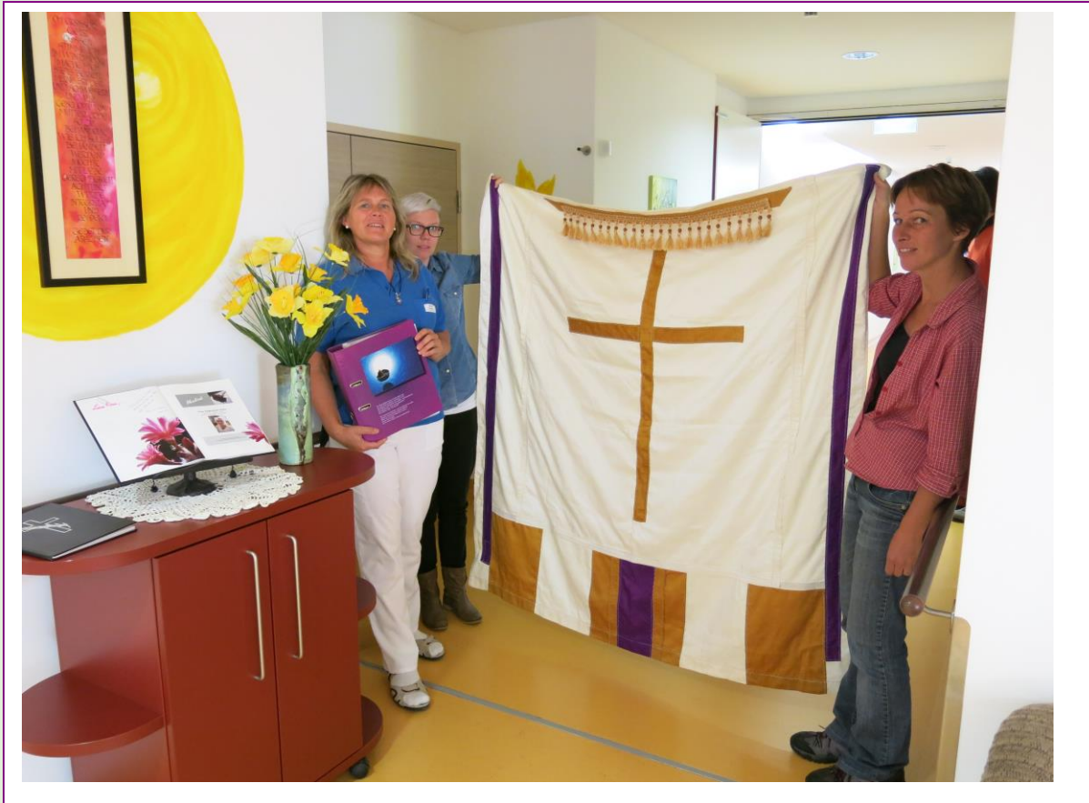
Das Aufbahrungstuch im Bezirksseniorenhaus Gramastetten, gefertigt von der Arbeitsgruppe „Palliative Pflege in der Geriatrie“;

In einigen Pflegeeinrichtungen wurden wunderschöne Gedenktische gestaltet und Aufbahrungsbettwäsche genäht.