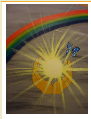
Das Logo der Arbeitsgruppe „Palliative Pflege in der Geriatrie“ im Bezirksseniorenheim Freistadt.

Nachstehende Auflistung informiert beispielhaft über Ergebnisse der Arbeitsgruppen in den verschiedenen Altenheimen und Seniorenwohnhäusern: Die Arbeitsgruppe des Bezirksseniorenheimes in Freistadt befasste sich mit der Haltung im Kontext von Palliative Care durch Gestaltung eines Logos. Das Bild wurde im Eingangsbereich des Altenheimes aufgehängt, wo auch eine Beschreibung des Symbolgehaltes nachzulesen ist.