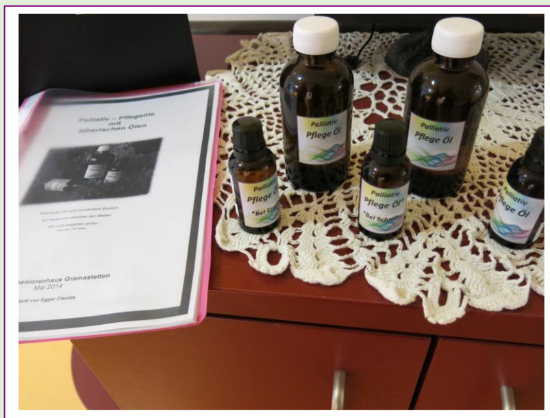
Palliative Pflegeölmischungen zur beruhigenden Einreibung im Bezirksseniorenhaus Gramastetten.