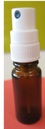
Mikrozerstäuber zur Befeuchtung der Mundschleimhaut

Sie können ihrem Angehörigen wohlschmeckende Flüssigkeiten verabreichen. Die Flüssigkeit, der Ananassaft zum Beispiel, wird dabei fein zerstäubt und ein Verschlucken (Aspirieren) von Flüssigkeiten wird dadurch vermieden.