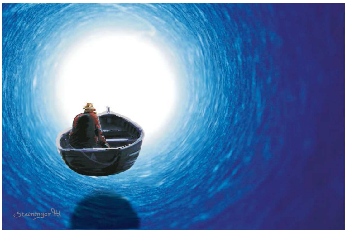
Bildnis, gemalt von Hans-Jürgen Steininger, 2014.

Wie Angehörige ihre Lieben in der letzten Phase des Lebens begleiten können.